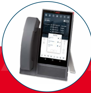
K175 Avaya Vantage™