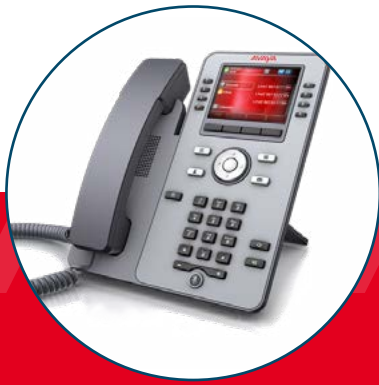
J179 Avaya IP-Telefon