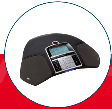
B179 Avaya SIP Konferenztelefon